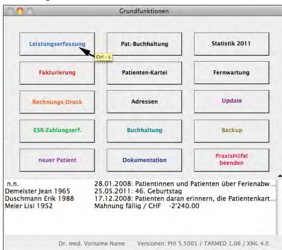
Abbildung 17: Hilfstext Funktionserklärung